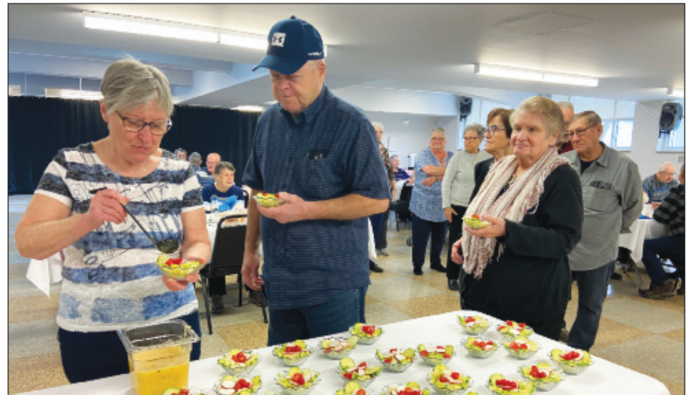
Les bénéficiaires se servent lors d'un dîner-soleil.